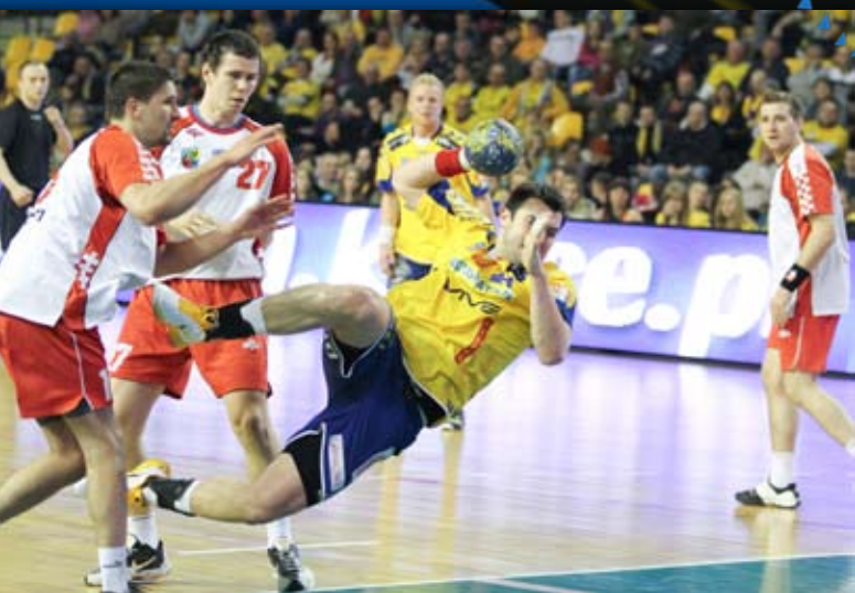
Vive Targi Kielce - SPR Chrobry Głogów (15.02.2011)