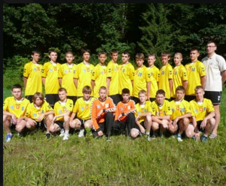
Obóz w Muszynie