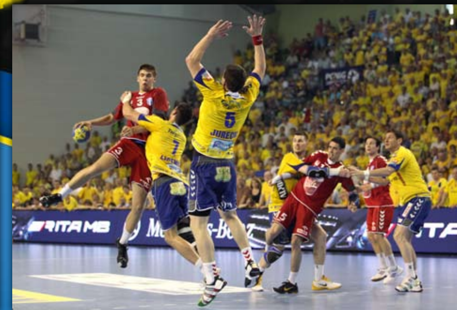
Vive Targi Kielce - Orlen Wisła Płock, 2 Final Play Off (22.05.2011)