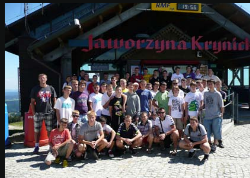
Obóz w Muszynie