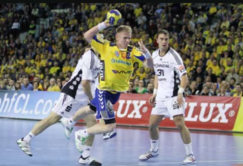
Liga Mistrzów - Vive Targi Kielce - THW Kiel (06.03.2011)